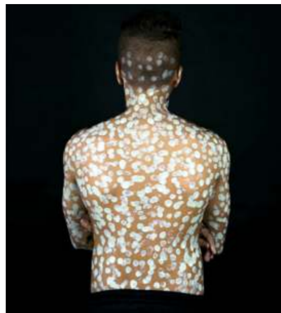
From The Other Side Of Daylight, 2017